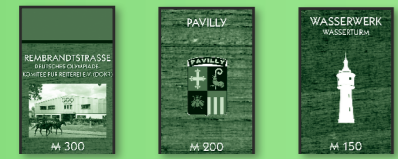
Straßen (Farbgruppen) Partnerstädte Versorgungswerke

Sie können das Grundstück zu dem regulären Preis kaufen , der auf dem Spielplan steht. Zahlen Sie den Betrag an die Bank, lassen Sie sich vom Bankhalter die Besitzrecht-karte geben und legen Sie diese offen vor sich ab.