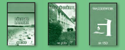
Orte (Farbgruppen) Schulen Versorgungswerke

Du kannst das Grundstück zu dem regulären Preis kaufen , der auf dem Spielplan steht. Zahle den Betrag an die Bank, lasse dir vom Bankhalter die Besitzrecht-karte geben und lege diese offen vor dir ab.