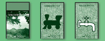
Orte (Farbgruppen) Bahnhöfe Versorgungswerke

Du kannst das Grundstück zu dem regulären Preis kaufen , der auf dem Spielplan steht. Zahle den Betrag an die Bank, lasse dir vom Bankhalter die Besitzrecht-karte geben und lege diese offen vor dir ab.