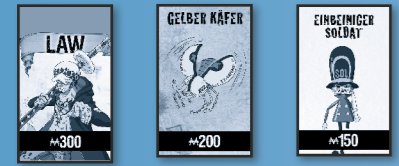
Charaktere (Farbgruppen) Transportmittel Koala und Einbeiniger Soldat

Du kannst das Grundstück zu dem regulären Preis kaufen, der auf dem Spielplan steht. Zahle den Betrag an die Bank, lasse dir vom Bankhalter die Besitzrecht-karte geben und lege diese offen vor dir ab.