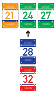
Abbildung 6: seitlich anlegen