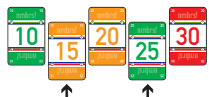
Abbildung 5: einfügen