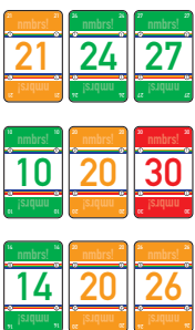
Abbildung 3: zulässige Reihen